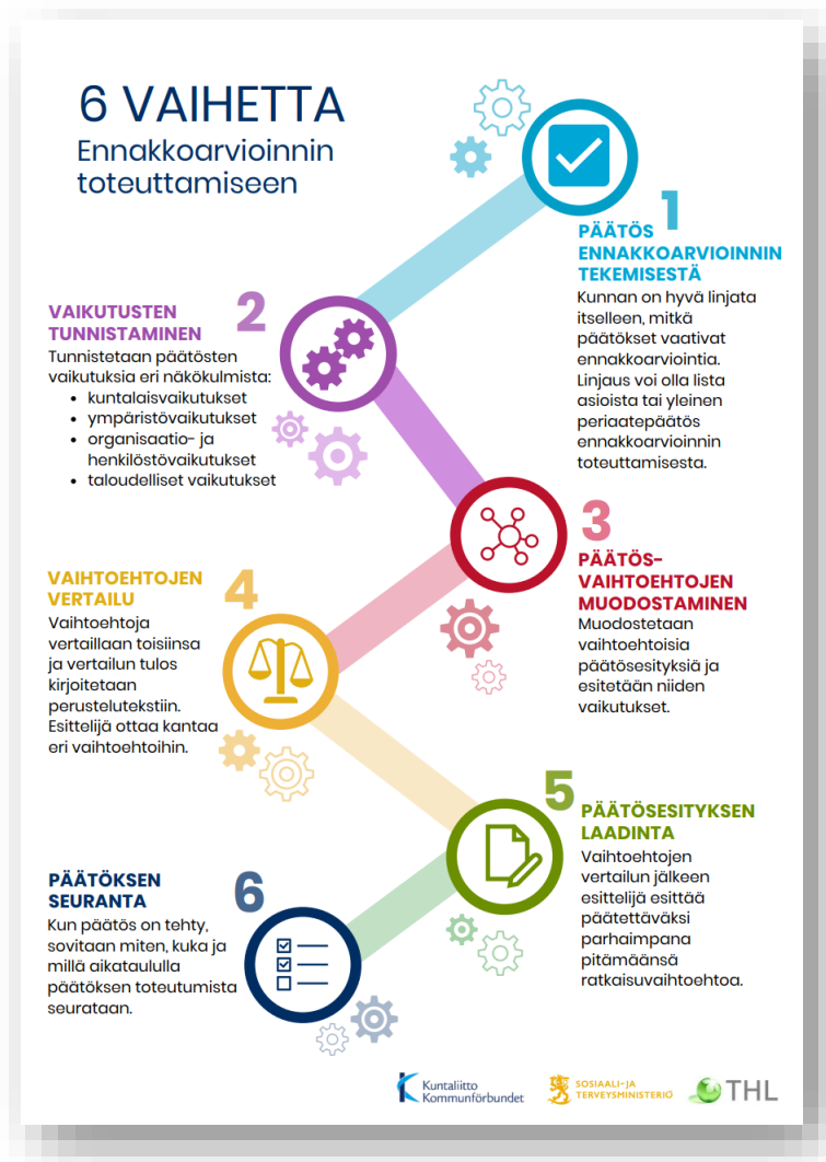
Kuvio 1. Kuusi vaihetta ennakoarvioinnin toteuttamiseen ( https://www.julkari.fi/handle/10024/136834 )

Vaiheet on esitetty lyhyesti seuraavassa kuviossa.